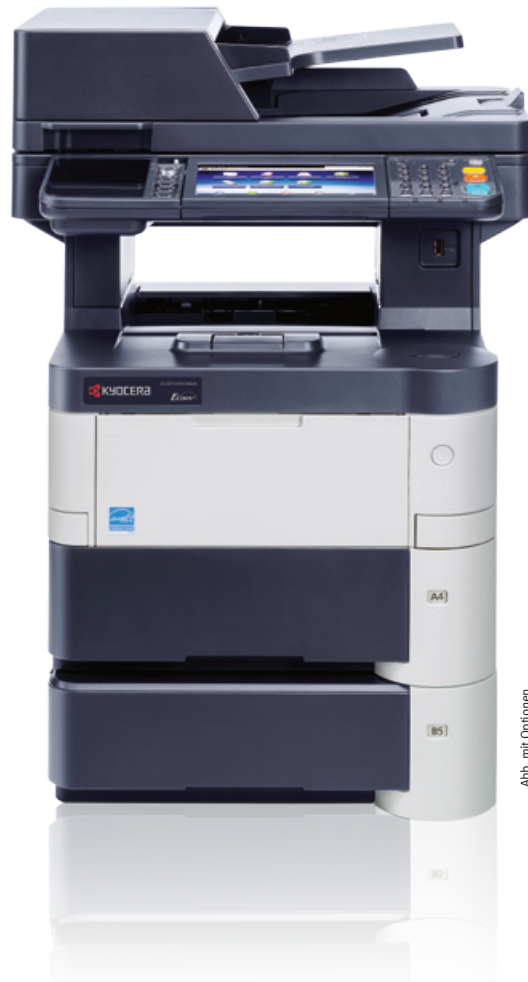
Abb. mit Optionen